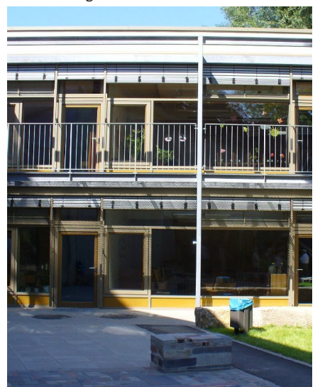
Innenhofbereich der Kita