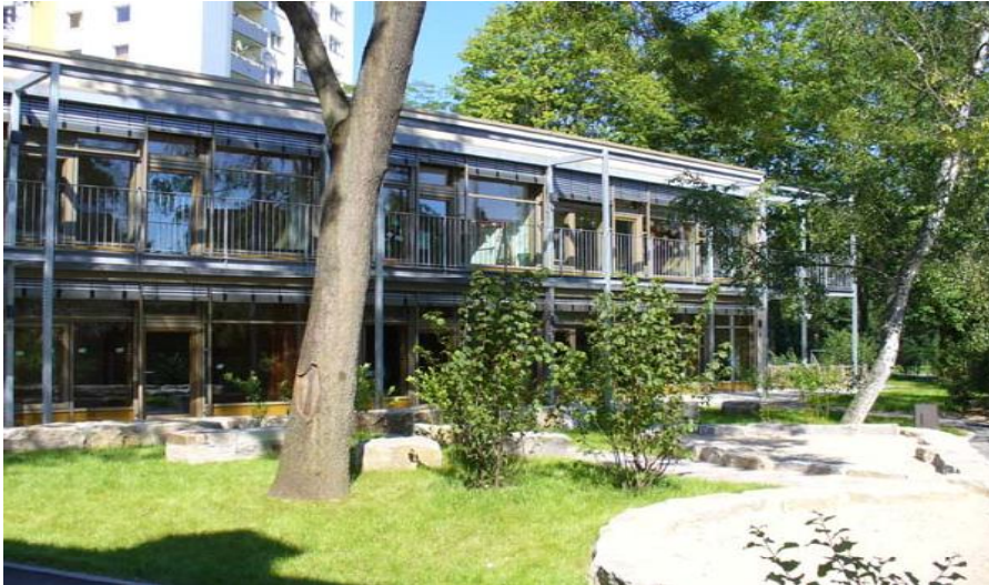
Südliche Außenansicht mit Fluchtbalkon