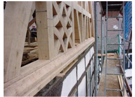
Neuer Giebel auf alter Ständerwand