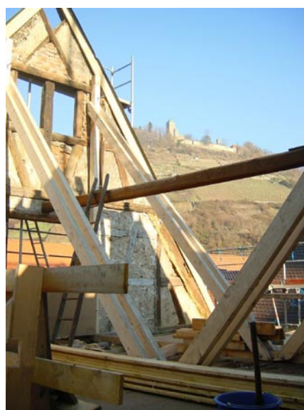
Sicherung der Giebel in der Bauphase