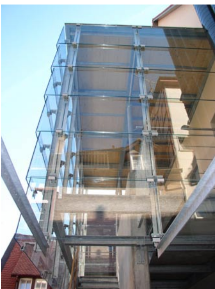
neue Erschließung auf der Rückseite

Bei dem Bauvorhaben handelt es sich um die Sanierung eines Fachwerkhauses am Marktplatz in Heppenheim. Es waren umfangreiche Reparaturmaßnahmen an der vorh. Fachwerkstruktur notwendig. Zusätzlich wurden im Inneren Umbauten für den Einbau einer Gaststätte im EG und OG erforderlich. Das DG erhielt eine Wohnung mit einer außen liegenden Erschließung auf der Nordseite in Form einer Beton-, Stahl-, Glaskonstruktion.