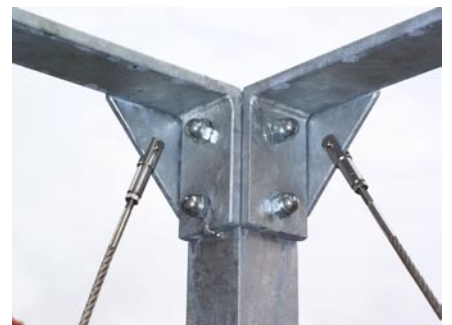
Detail neue Erschließung