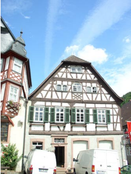
Ansicht vom Marktplatz