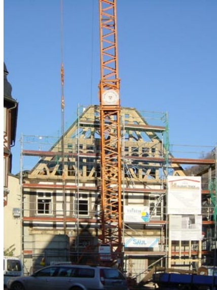
Aufschlagen des neuen Giebels