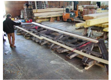
Abbund und Sanierung der Giebel