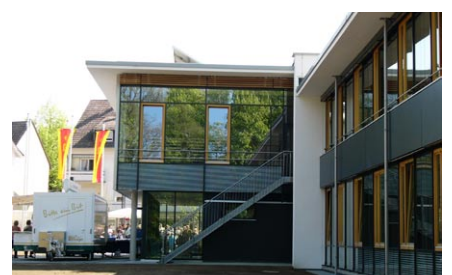
Sitzungssaal (OG) u. Bistro (EG)