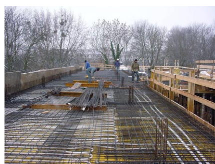
Deckenbewehrung mit Betonkernaktivierung