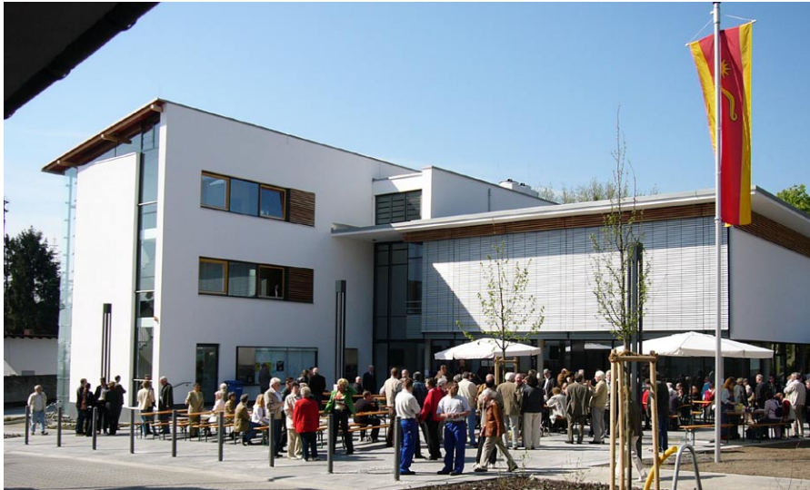
straßenseitige Ansicht von Verwaltung (links) und Sitzungssaal (rechts)