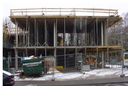
Sitzungssaal im Rohbau

Der Neubau des Rathaus besteht aus einem 3-geschossigen, länglichen Verwaltungsbereich und einem zweigeschossigen Anbau mit einem Bistro im EG und einem Sitzungssaal im Obergeschoss. Das gesamte Gebäude steht auf einem zur weißen Wanne ausgebildeten Kellergeschoss. Der Keller wurde mit massiven Wänden in Stahlbeton und Mauerwerk ausgeführt, ab dem EG kam Skelettbauweise zur Anwendung.