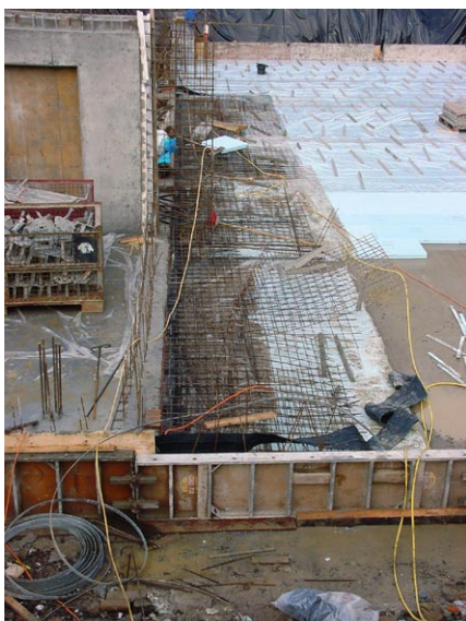
Betonierfuge im KG