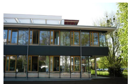
Ansicht vom Park