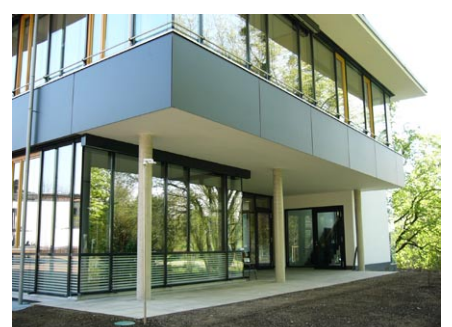
Ansicht vom Park