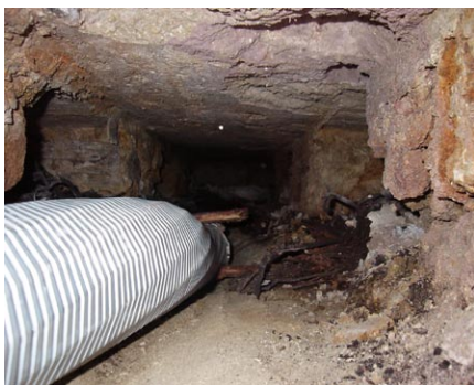
Aussaugen der Holzbalkenreste

Vom Staatsbauamt Darmstadt wurde 2001 ein Gutachten zur Ermittlung des Sanierungsbedarfs des Darmstädter Schlosses in Auftrag gegeben. Bei diesem Gutachten wurde u.a. festgestellt, dass verschiedene Baukörper starke Schäden durch Auflösen der Holzroste unter den Außenmauern im Gründungsbereich zeigen. Es haben sich bereits starke Verformungen und Risse eingestellt, die eine umgehende Sanierung der Gründung notwendig machten.