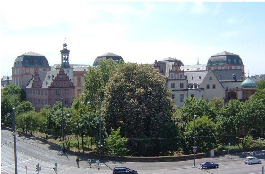
Ansicht des Stadtschlusses von Nordosten mit Glocken- und Kirchenbau