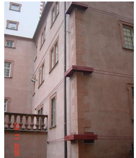
Äußere Verspannung Glockenbau