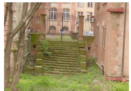
Treppe am Südgiebel Glockenbau