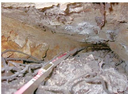
Ehem. Holzroste unter dem Fundament