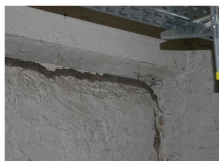
Verschiebung Außenwand zu Innenwand