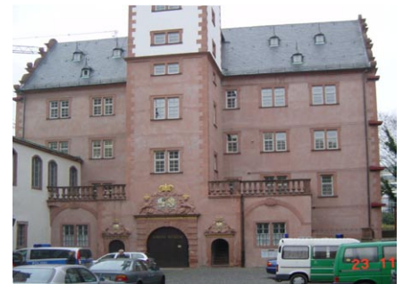
Glockenbau vom Glockenhof

Architekt Die Baurunde Offenbach Bauherr Technische Universität Darmstadt Objekt Erstellung eines Gutachtens mit Schadensaufnahme und Feststellung des Sanierungsbedarfs für das Residenzschloss in Darmstadt, vorgezogene Maßnahmen zur Gründungssicherung des Glocken-, Kirchen- und Herrenbaus sowie Instandsetzung der Wallbrücke auf der Nordseite Bauzeit 2001 - heute Bearbeitung J. Schlier, M. Müller, A.Sauter